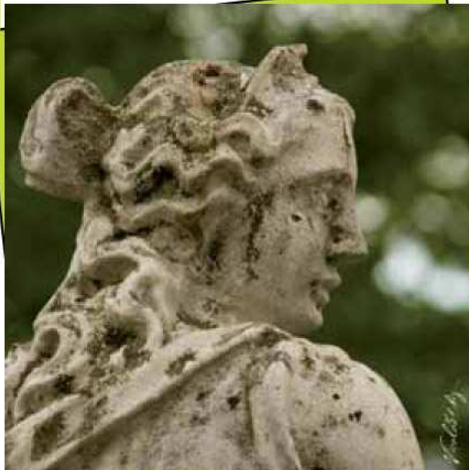
Statue nei giardini della Fagianaia Reale (Saint Georges Premier) - Parco di Monza Stampa su canvas 120x120 cm